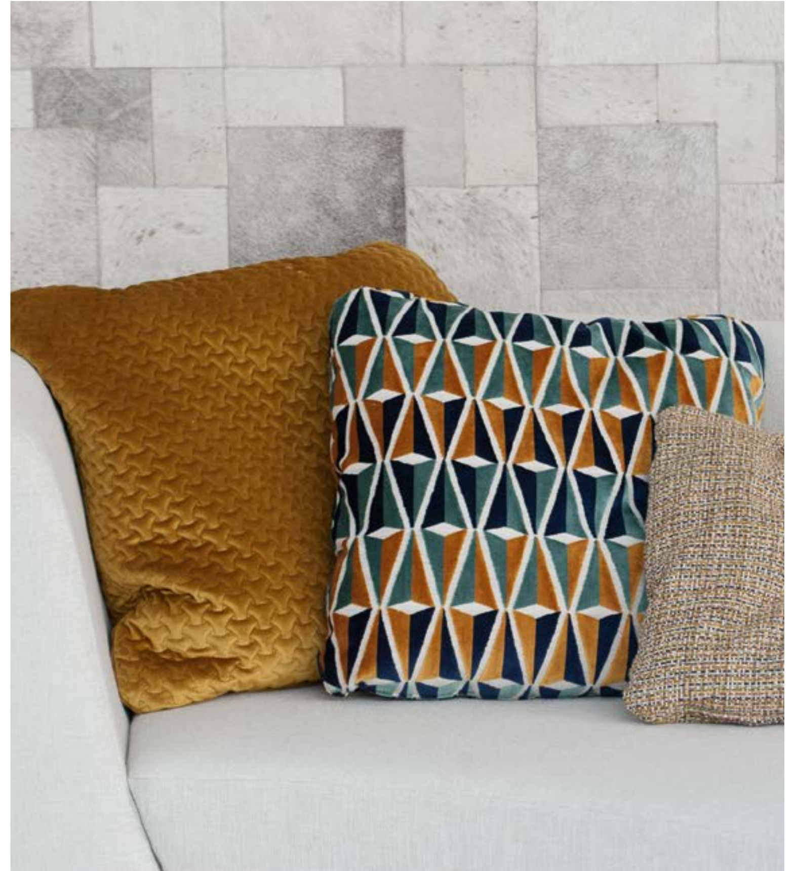
Almohadilla 70x70 (izquierda) en terciopelo bordado Intreccio C/17 (S.8). Almohadilla 60x60 (centro, geometrico) en tela Felis 3950 0387 (S.8).

Pillow 50x50 (left) in velvet with geometric pattern Avant la lettre CA1365/070 (S.9). Pillow 50x50 (center, beige) with embroidered logo in fabric Avance CA1364/092 (S.8). Pillow 50x50 (right, rhombus) in printed velvet Villa CA1432/070 (S.E).