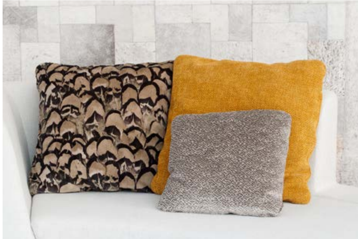
Almohadilla 70x70 (izquierda) en tela Niara C/21 (S.E). Almohadilla 70x70 (mostaza) en tela Axum C/31 (S.6). Almohadilla 50x50 (derecha) en tela Avalanche CA1366/070 (S.9).

Pillow 70x70 (left) in fabric Niara C/21 (S.E). Pillow 70x70 (mustard) in fabric Axum C/31 (S.6). Pillow 50x50 (right) in fabric Avalanche CA1366/070 (S.9).