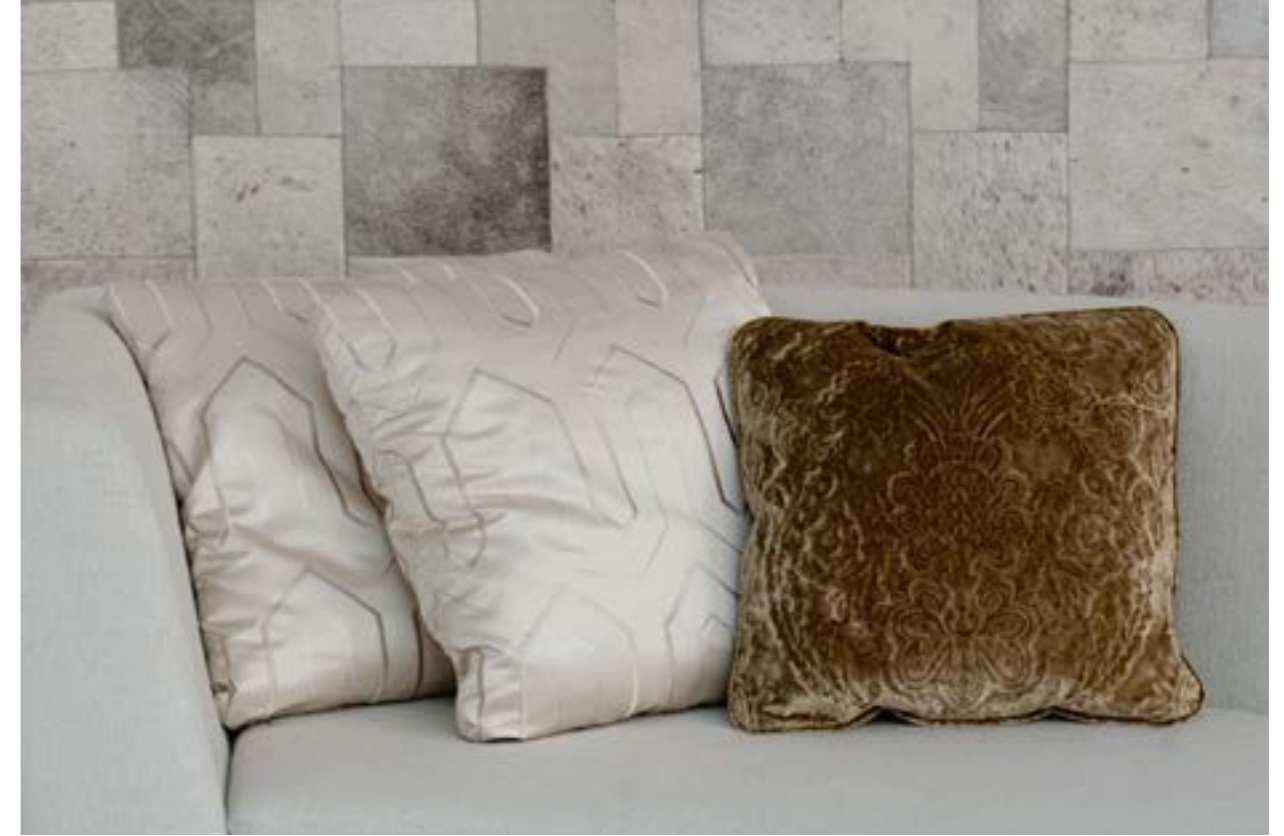
Almohadilla 60x60 (izquierda) en seda bordada Gastby F1070/04 Ivory (S.4). Almohadilla 50x50 (derecha) en terciopelo labrado Erbusco Spice 9037/03 (S.E).

Pillow 70x70 (left) in fabric Astrakhan 002 TJ0654-002-140 (S.8). Pillow 50x50 (right) in fabric Trona c/1611 (S.E) front a exclusive collection of Calvin Klein.