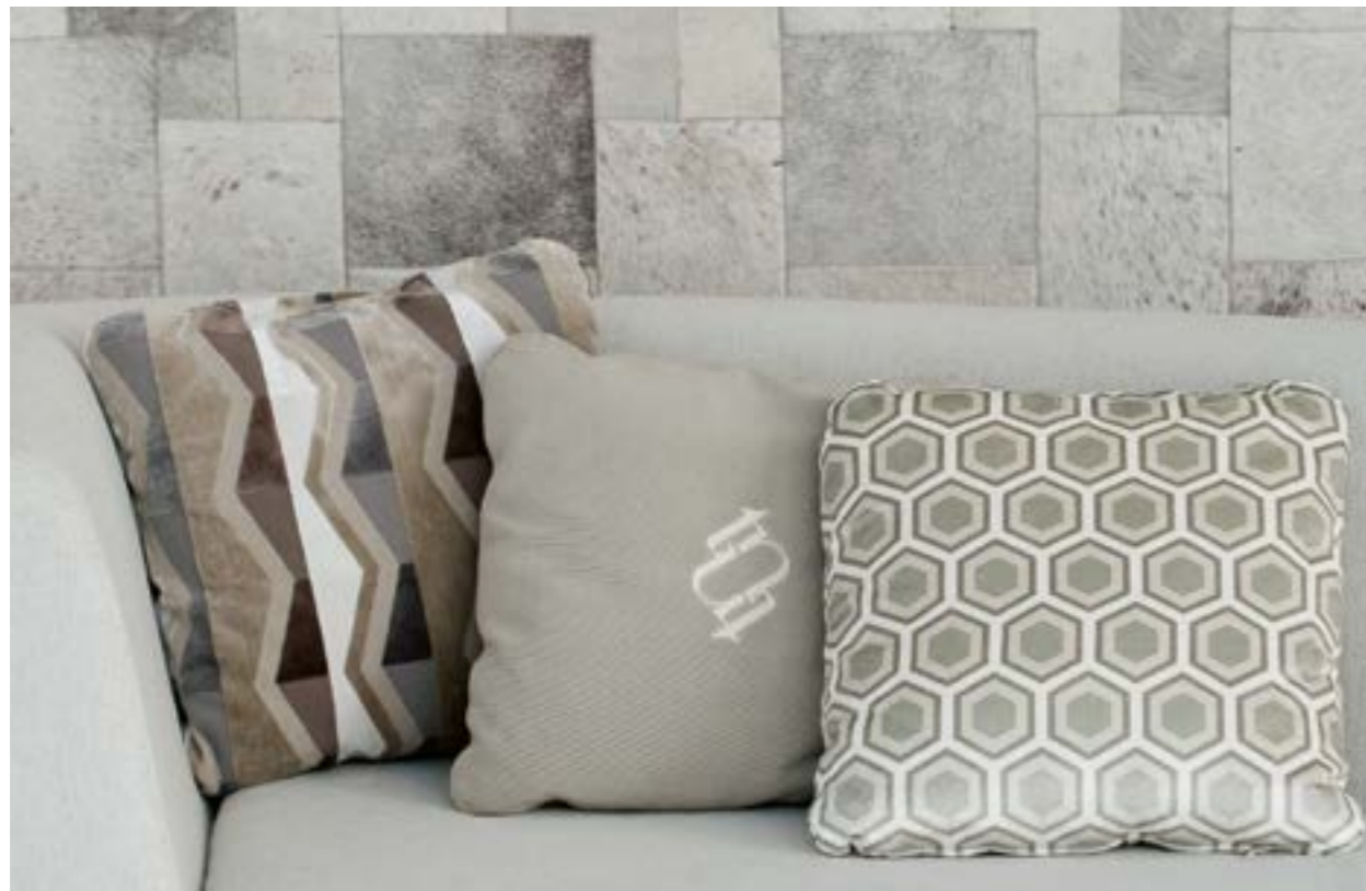
Almohadilla 50x50 (izquierda) en terciopelo con motivos geometricos Avant la lettre CA1365/070 (S.9). Almohadilla 50x50 (centro, beige) con logotipo bordado en tela Avance CA1364/092 (S.8). Almohadilla 50x50 (derecha, rombos) en terciopelo estampado Villa CA1432/070 (S.E).

Pillow 50x50 (left) in velvet with geometric pattern Montecristo 3949 0489 (S.8). Pillow 50x50 (center, beige) with side bands in fabric Skintilla 132550 Taupe (S.9). Pillow 50x50 (right, blue) with side bands in fabric Skintilla 132551 Kingfisher (S.9).