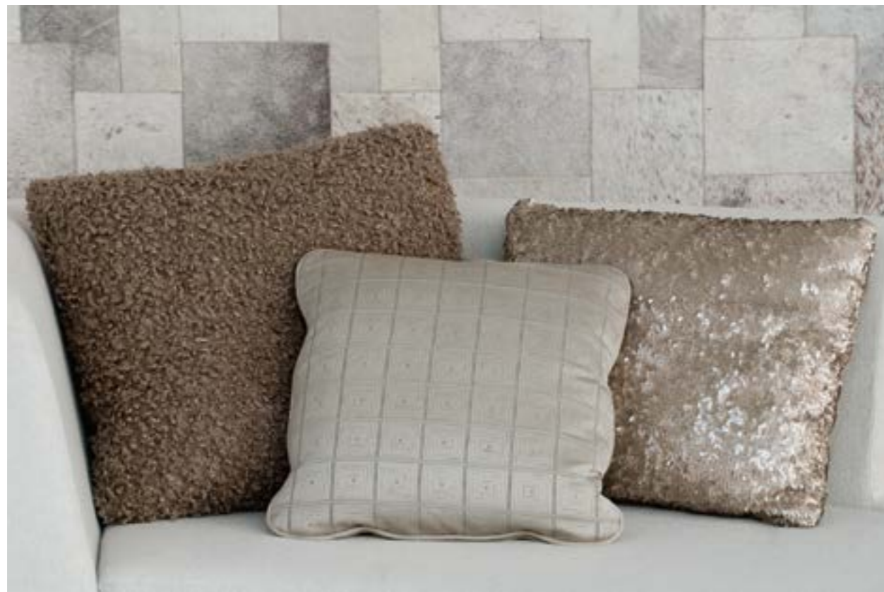
Almohadilla 70x70 (izquierda) en tela Astrakhan 002 TJ0654-002-140 (S.8). Almohadilla 50x50 (centro) en tela Trona 34586 C/1611 (S.E), que pertenece a la colección exclusiva diseñada por Calvin Klein.

Pillow 50x0 (izquierda) in fabric Goat 002 TJ0655-002-140 (S.6). Pillow 60x60 (center) with embroidered fabric Carraway F1070-03 Linen (S.8). Pillow 50x50 (right) in fabric Kravet 34213 C/16 (S.E) front a exclusive collection of Calvin Klein.