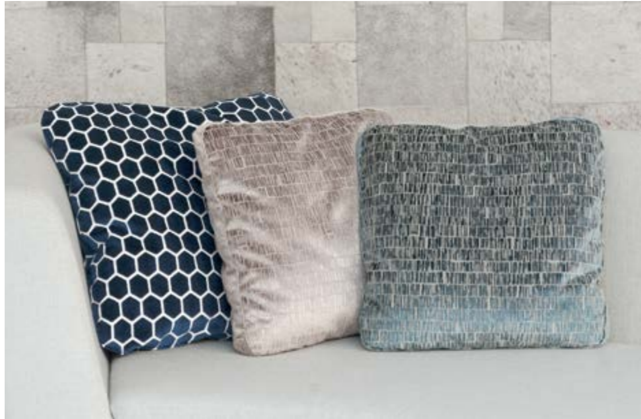
Almohadilla 60x60 (izquierda) en terciopelo con motivos geometricos Montecristo 3949 0489 (S.8). Almohadilla 50x50 (centro, beige) con bandas laterales en tela Skintilla 132550 Taupe (S.9). Almohadilla 50x50 (derecha, azul) con bandas laterales en tela Skintilla 132551 Kingfisher (S.9).

Pillow 50x50 (left) in velvet with geometric pattern Montecristo 3949 0489 (S.8). Pillow 50x50 (center, beige) with side bands in fabric Skintilla 132550 Taupe (S.9). Pillow 50x50 (right, blue) with side bands in fabric Skintilla 132551 Kingfisher (S.9).