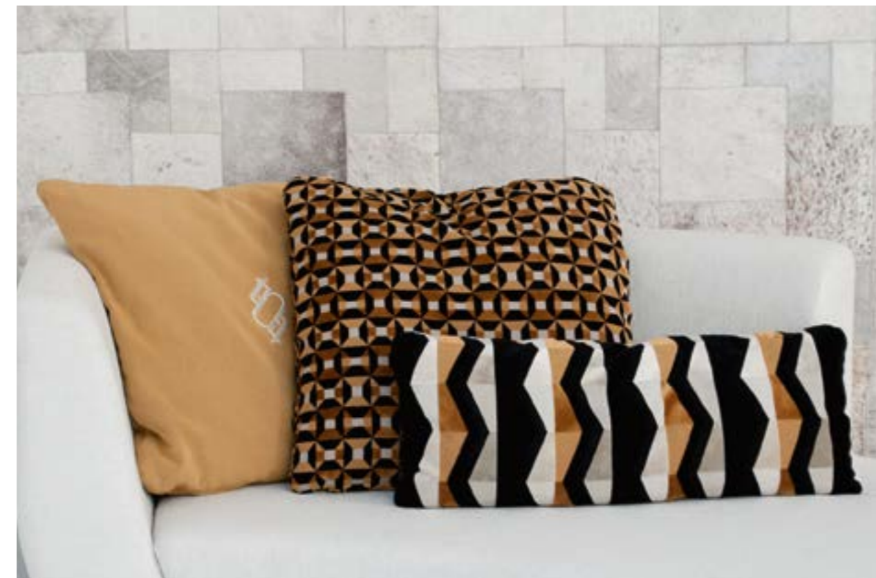
Almohadilla 70x70 (izquierda) en tela Avance CA1364/020 (S.8). Almohadilla 70x70 (centro) en terciopelo con motivos geometricos Avant-Garde CA1362/020 (S.8). Almohadilla 30x75 (derecha) en tela Avant la lettre CA1365/020 (S.9).

Pillow 70x70 (left) in fabric Axum C/31 (S.6). Pillow 35x60 (center) in fabric BW 1017 F0890/01 (S.9). Pillow 35x60 (right) in fabric Chobe 7743 C/07 (S.8).