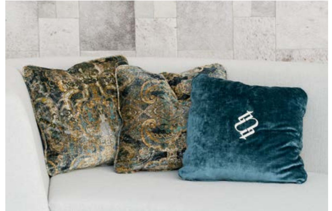
Almohadilla 50x50 (izquierda) en terciopelo estampado Maroque Meteor 9035/01 (S.E). Almohadilla 50x50 (derecha) en terciopelo con logotipo bordado en Vegas Velvet Plain Dis.1403 C/34 (S.6).

Pillow 70x70 (center) in velvet with tropical pattern Nusa Dua 7298 C/001 (S.E). Pillow 50x50 (orange) with embroidered logo in fabric Muscari 1-6891-060 (S.3).