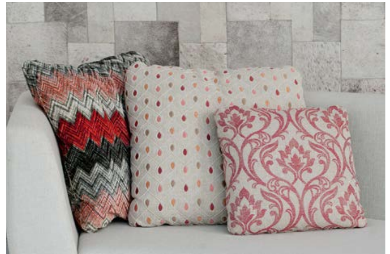
Almohadilla 70x70 (izquierda) en tela Zenith 9019/05 Cinnabar (S.E). Almohadilla 70x70 (centro) en tela Healey F0936/05 Spice (S.7). Almohadilla 50x50 (derecha) en Leyburn F0938/06 (S.2).

Pillow 60x60 (left) in embroidered silk Gastby F1070/04 Ivory (S.4). Pillow 50x50 (right) in carved velvet Erbusco Spice 9037/03 (S.E).