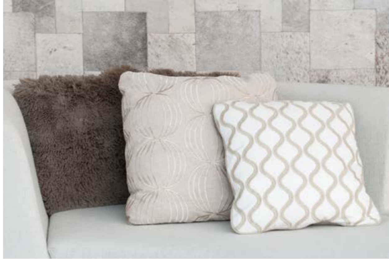
Almohadilla 50x50 (izquierda) en tela Goat 002 TJ0655-002-140 (S.6). Almohadilla 60x60 (centro) en tela bordada Carraway F1070/03 Linen (S.8). Almohadilla 50x50 (derecha) en tela Kravet 34213 C/16 (S.E), que pertenece a la colección exclusiva diseñada por Calvin Klein.

Pillow 50x0 (izquierda) in fabric Goat 002 TJ0655-002-140 (S.6). Pillow 60x60 (center) with embroidered fabric Carraway F1070-03 Linen (S.8). Pillow 50x50 (right) in fabric Kravet 34213 C/16 (S.E) front a exclusive collection of Calvin Klein.