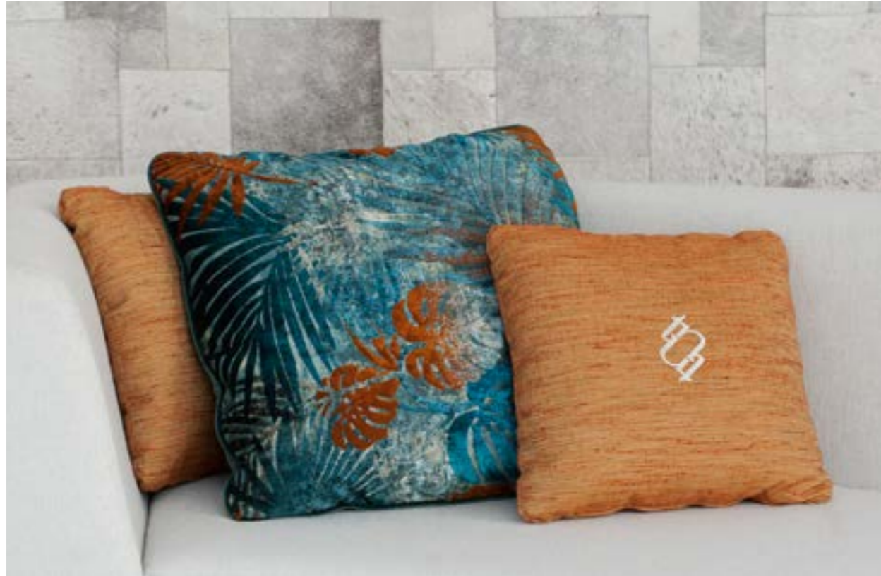
Almohadilla 70x70 (centro) en terciopelo con motivos tropicales Nusa Dua 7298 C/001 (S.E). Almohadilla 50x50 (naranja) con logotipo bordado en Muscari 1-6891-060 (S.3).

Pillow 70x70 (center) in velvet with tropical pattern Nusa Dua 7298 C/001 (S.E). Pillow 50x50 (orange) with embroidered logo in fabric Muscari 1-6891-060 (S.3).