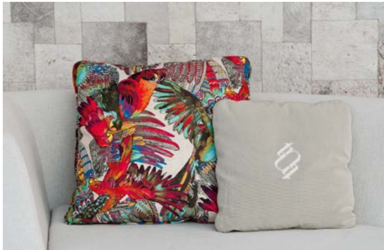
Almohadilla 70x70 (izquierda) en estampado con motivos tropicales Rio Outdoor 885 cosmos (S.8). Almohadilla 50x50 (derecha) con logotipo bordado en Avance CA1364/092 (S.8).

Pillow 70x70 (left) in print fabric with tropical pattern Rio Outdoor 885 cosmos (S.8). Pillow 50x50 (right) with embroidered logo in fabric Avance CA1364/092 (S.8).