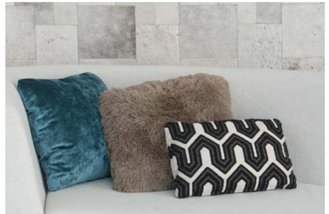
Almohadilla 50x50 (izquierda) en tela Vegas Velvet Plain Dis.1403 C/34 (S.6). Almohadilla 50x50 (center) en tela Goat 002 TJ0655-002-140 (S.6). Almohadilla 35x60 (derecha) en Buckingham C/6 (S.6).

Pillow 70x70 (left) in fabric Avance CA1364/020 (S.8). Pillow 70x70 (center) in velvet with geometric pattern Avant-Garde CA1362/020 (S.8). Pillow 30x75 (right) in fabric Avant la lettre CA1365/020 (S.9).