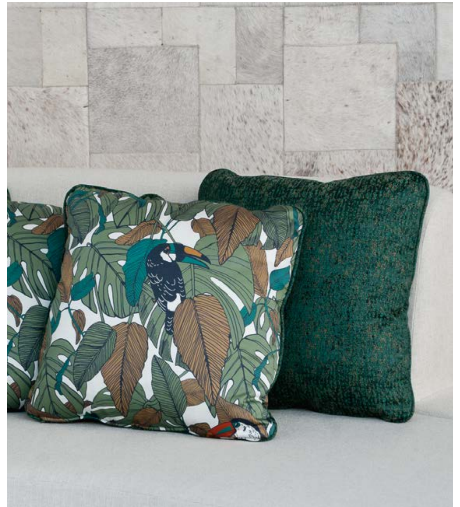
Almohadilla 50x50 (izquierda) en tela de estampado tropical Talamanca 4075 0117 (S.9), con vivos combinados. Almohadilla 50x50 (derecha) en tela Amboine 3921 1600 (S.9) con vivos.

Pillow 50x50 (left) in tropical print fabric Talamanca 4075 0117 (S.9) with combined piping. (Right) Pillow 50x50 in fabric Amboine 3921 1600 (S.9) with piping.