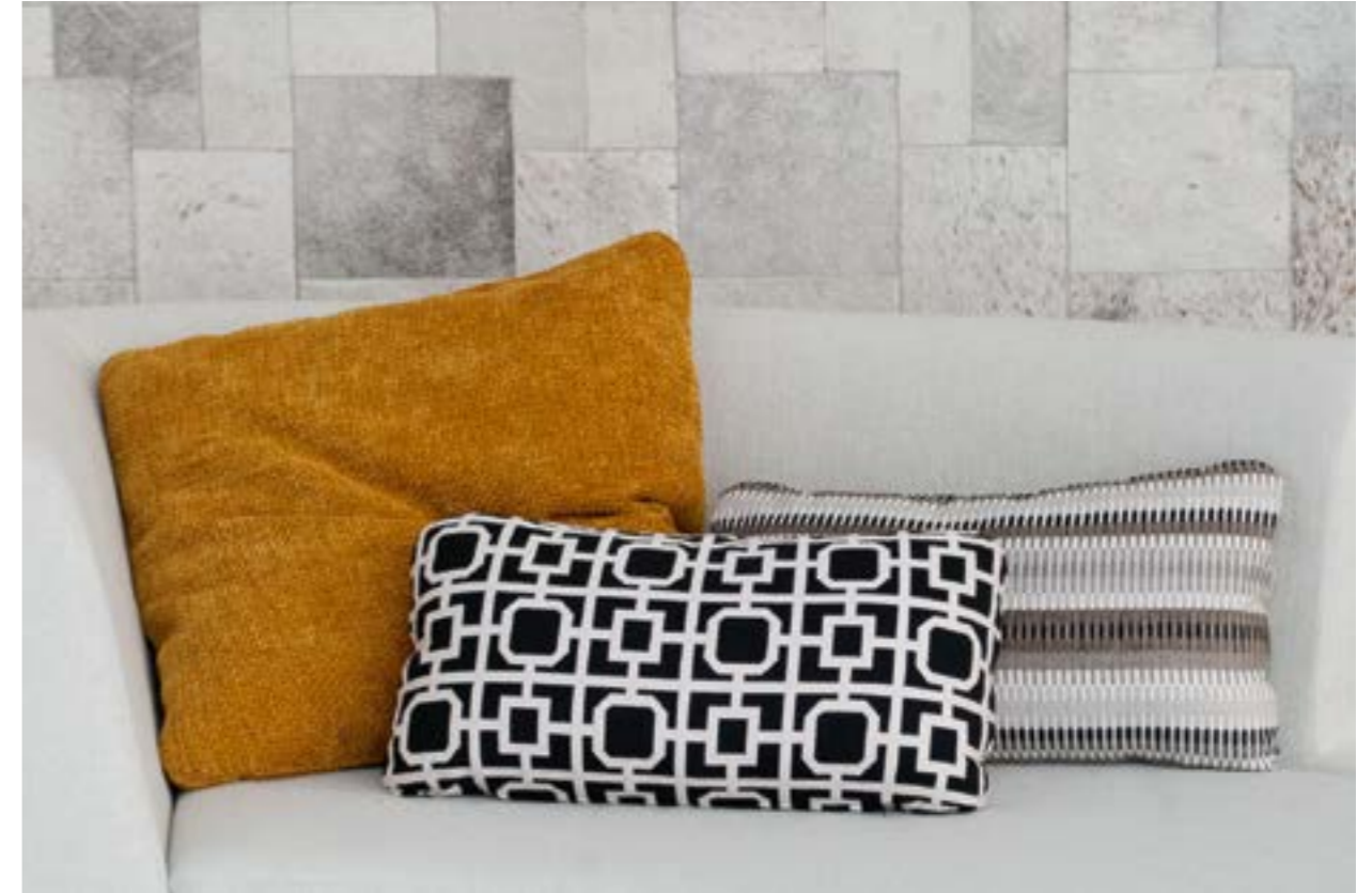
Almohadilla 70x70 (izquierda) en tela Axum C/31 (S.6). Almohadilla 35x60 (center) en tela BW 1017 F0890/01 (S.9). Almohadilla 35x60 (derecha) en tela Chobe 7743 C/07 (S.8).

Pillow 70x70 (left) in fabric Niara C/21 (S.E). Pillow 70x70 (mustard) in fabric Axum C/31 (S.6). Pillow 50x50 (right) in fabric Avalanche CA1366/070 (S.9).