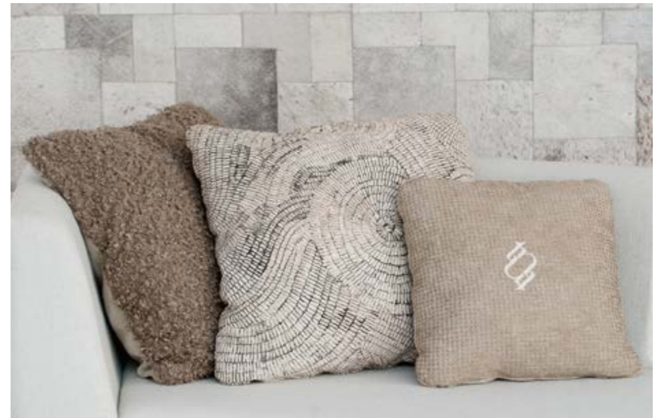
Almohadilla 70x70 (izquierda) en tela Astrakhan 002 TJ0654-002-140 (S.8). Almohadilla 70x70 (centro) en tela estampada Appia C/06 (S.E). Almohadilla 50x50 (derecha) con logotipo bordado en Tarraco C/05 (S.E).

Pillow 70x70 (left) in print fabric with tropical pattern Rio Outdoor 885 cosmos (S.8). Pillow 50x50 (right) with embroidered logo in fabric Avance CA1364/092 (S.8).